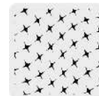
Tejido de punto al frente