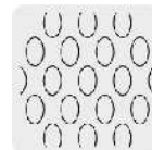
Malla al reverso