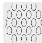
Malla al reverso